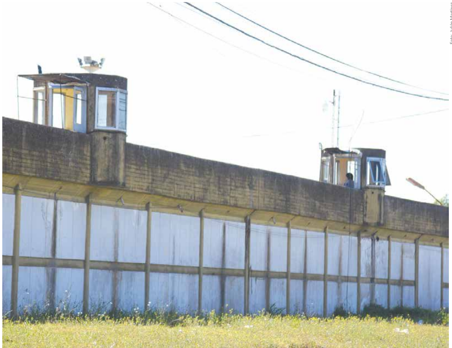
En la Provincia hay más de 50 mil detenidos

Buenos Aires, la cantidad de internos al cierre del año pasado fue de 51.904, lo que selló el aumento anual de detenidos más grande desde 2017. La tendencia es ascendente desde 2008 y alcanza los máximos picos en los últimos cinco años.