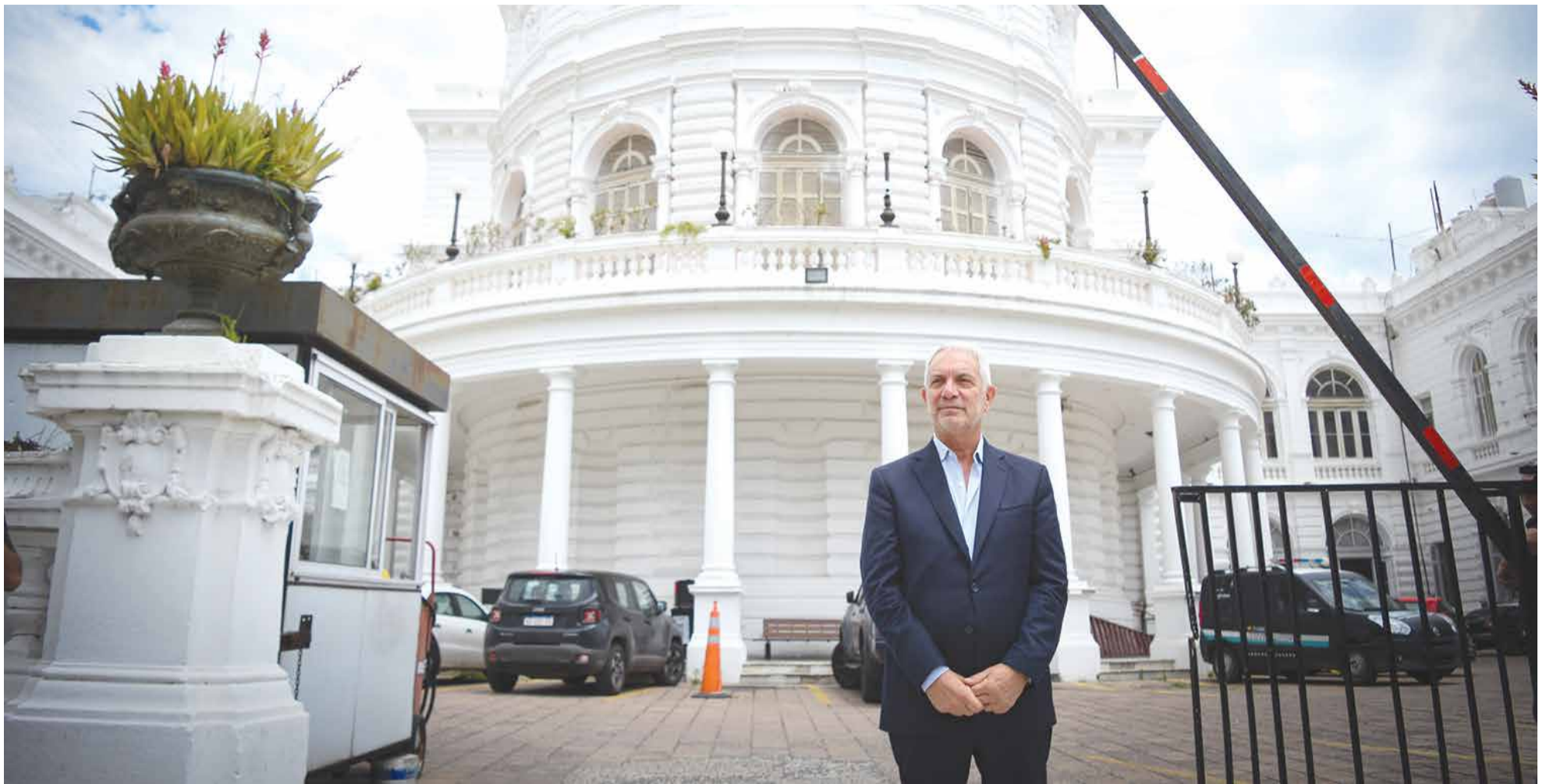
Un intendente cuestionado

En este primer año de gestión, este rol lo cumplió la Unión Cívica Radical quien le permitió aprobar una serie de proyectos claves para la administración alakista como el Presupuesto 2025, la suba de tasas y el Plan 1.000 Obras, una iniciativa del Ejecutivo para llevar obras de infraestructura a barrios de la periferia y el casco con parte del financiamiento por parte de los frentistas que desencadenó una ola de críticas por parte de la oposición más dura.