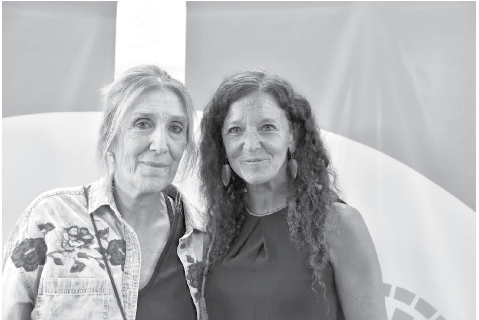
El pasado y presente de la Defensoría

Por otro lado, al ser consultada sobre si habló con su antecesora, la flamante defensora aseguró que tuvo un diálogo previo a la asunción y que además “yo la convoqué y le dije que me encantaría que ella esté, que quería que me