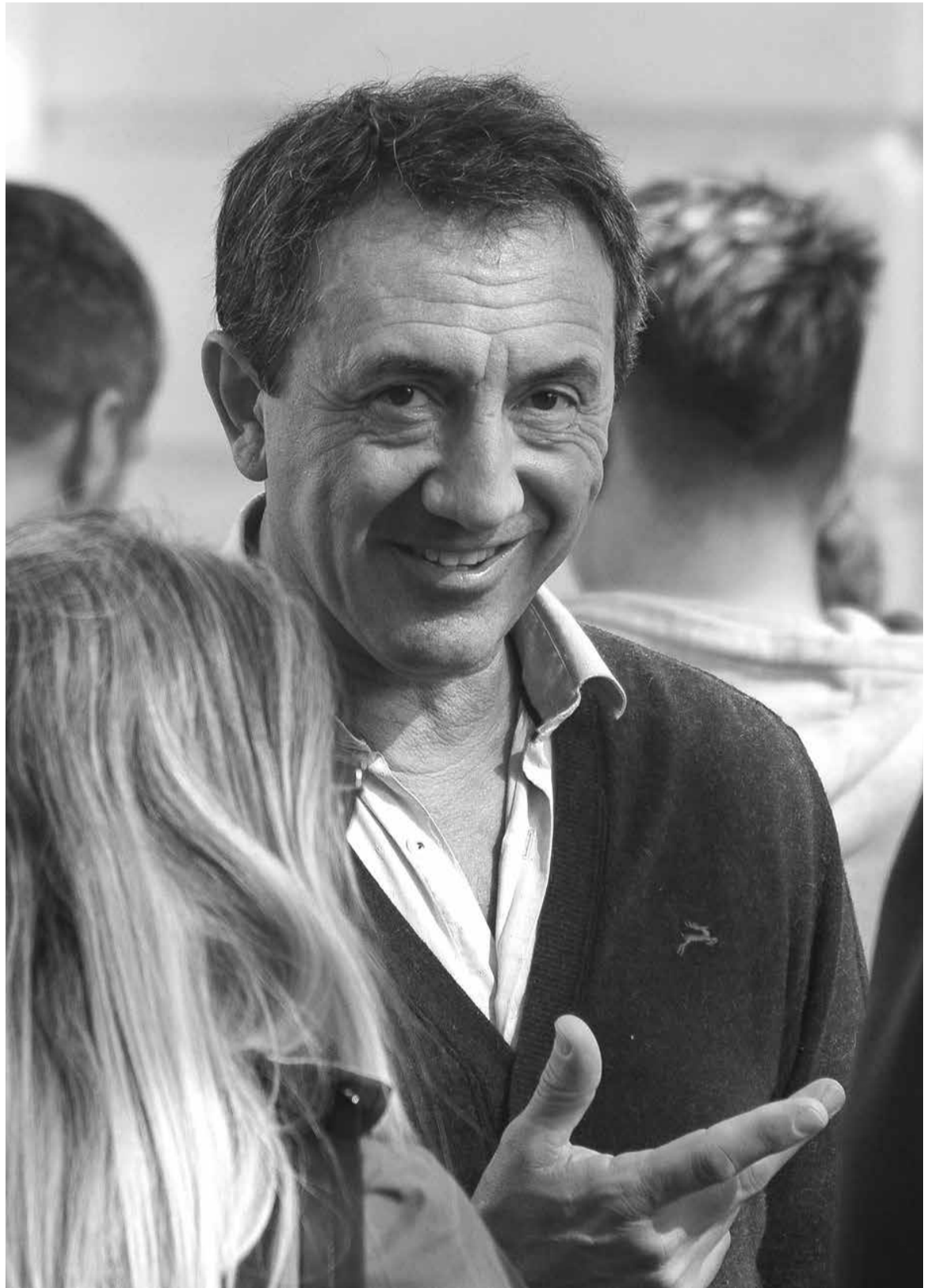
Cowen quiere ir por la reelección, pero para eso deberá construir un equipo que luche por objetivos importantes

Hay más agrupaciones que pretenden participar con una